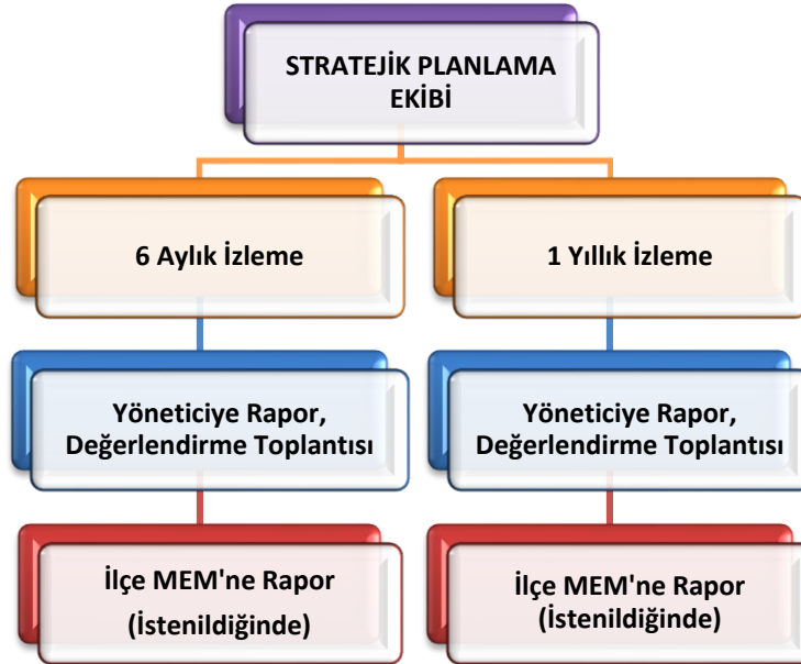
Şekil 8 Stratejik Plan İzleme ve Değerlendirme Modeli

Okulumuz Stratejik Planı izleme ve değerlendirme çalışmalarında 5 yıllık Stratejik Planın izlenmesi ve 1 yıllık gelişim planının izlenmesi olarak ikili bir ayrıma gidilecektir. Stratejik planın izlenmesinde 6 aylık dönemlerde izleme yapılacak denetim birimleri, il millî eğitim müdürlüğü ve Bakanlık denetim ve kontrollerine hazır halde tutulacaktır. Yıllık planın uygulanmasında yürütme ekipleri ve eylem sorumlularıyla aylık ilerleme toplantıları yapılacaktır. Toplantıda bir önceki ayda yapılanlar ve bir sonraki ayda yapılacaklar görüşülüp karara bağlanacaktır. 2024-2028 yıllara göre faaliyet raporları (Haziran-Temmuz) hazırlanarak İl / İlçe Milli Eğitim Müdürlüğü Strateji Geliştirme Hizmetleri Şube Müdürlüğüne gönderilmek üzere hazır tutulacaktır.